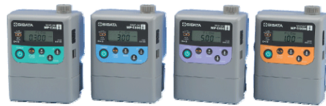
MP-Σ30型 MP-Σ300型 MP-Σ500型 MP-Σ100H型